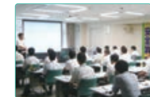
環境関連法令研修

「ものづくり」と環境問題は密接に関わっています。環境法令を中心とした環境教育は、これからの「ものづくり」に欠かすことのできないものです。このような視点から2013年度も各所社で研修会を開催。多くの従業員が自己研鑽に取り組みました。